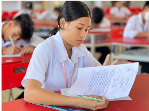
(សកម្មភាពសិស្សានុសិស្សកំពុងប្រឡង)

នៅឆ្នាំសិក្សាថ្មី ២០២៣-២០២៤ នេះកម្មវិធី សាលារៀនជំនាន់ថ្មី វិទ្យាល័យ ព្រែកលៀប បាន ផ្សព្វផ្សាយដំណឹងដល់មាតា បិតា អាណា-