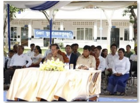
(សកម្មភាពក្នុងកម្មវិធីបើកបរវេសនកាលនៅវិទ្យាល័យ ព្រែកលៀប ឆ្នាំសិក្សា២០២៣-២០២៤)