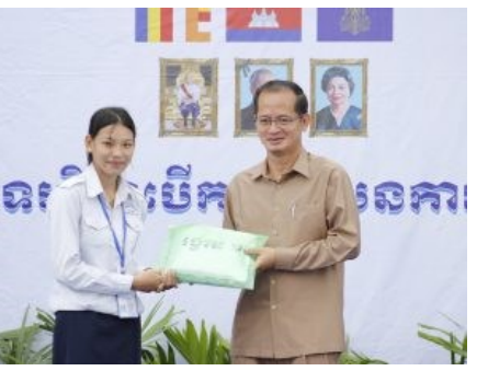
(ពិធីចែកលិខិតថ្លែងអំណរគុណ និងប័ណ្ណសរសើរ)